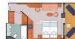
Floor Diagram Suite Sleeps up to: 3 42 Cabins Cabin: 337 sqft (31 m 2 ) * Size may vary, see details below.