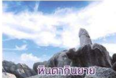
หินตาหินยาย