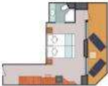
Floor Diagram Mini Suite Sleeps up to: 2 18 Cabins Cabins: 344 sqft (32 sqm) * Size may vary, see details below.