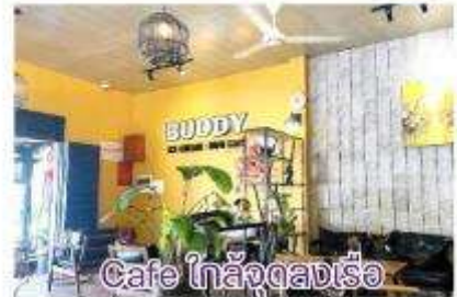
Cafe ไกล่จางเรือ