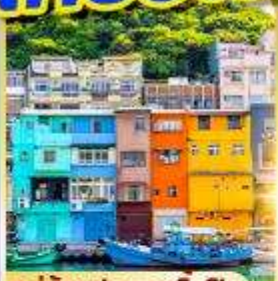
หมู่บ้านประมงเงินปิง