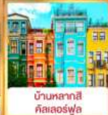
บ้านหลากสี คิสเลอร์ฟูล