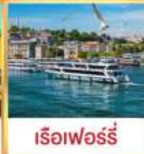
เรือเฟอร์รี่

เที่ยวครบเส้นทางยอดนิยม บินเข้าถึงเย็น เข้าชมสุเหร่ายักษ์คามลิก้า และล่องเรือเฟอร์รี่ ชมเทศกาลทิวลิปแห่งนครฮิสตันบูล