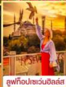
ลูฟท์อปเซเวนฮิลล์ส