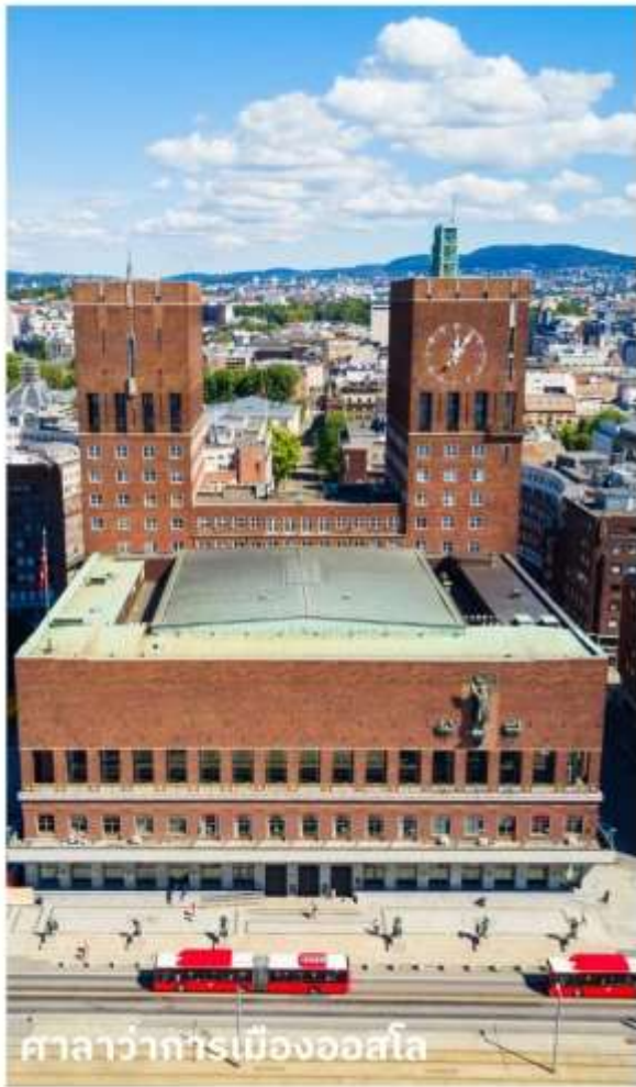
ศาลาว่าการเมืองออสโล