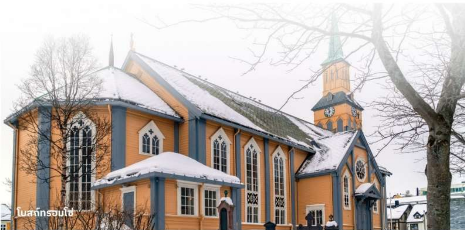
โบสถ์ทรอมโซ่

เป็นโบสถ์ที่ตั้งอยู่ใจกลางเมืองทรอมโซ่ มีสถาปัตยกรรมสวยงาม และเป็นโบสถ์ไม้ที่ใหญ่ที่สุดในนอร์เวย์ สถานที่นี้ไม่เพียงแต่เป็นที่สักการะ แต่ยังเป็นจุดท่องเที่ยวที่มีความสำคัญทางวัฒนธรรมอีกด้วย