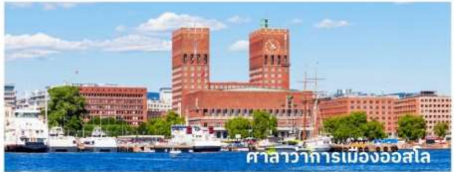
ศาลาว่าการเมืองออสโล