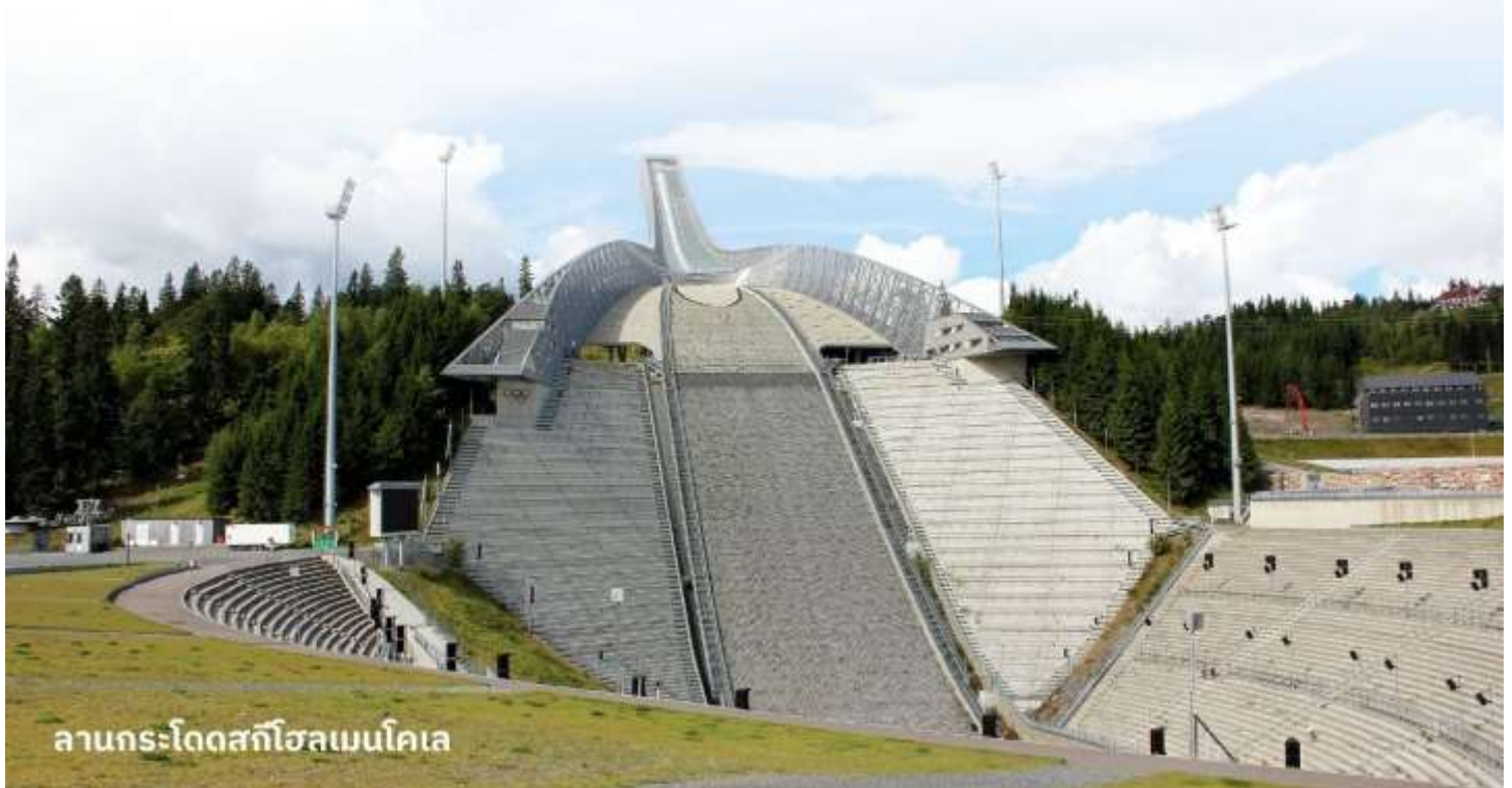
ลานกระโดดสกีโฮลเมนโคเลน

ตั้งอยู่ในเมืองออสโล ประเทศนอร์เวย์ เป็นหนึ่งในสถานที่ที่มีชื่อเสียงในวงการสกีกระโดด มีประวัติยาวนานและเป็นที่รู้จักอย่างกว้างขวางในการแข่งขันสกีกระโดดและการแข่งขันกีฬาฤดูหนาวอื่นๆ นอกจากนี้ยังมีพิพิธภัณฑ์เกี่ยวกับกีฬาและศูนย์ข้อมูลเกี่ยวกับประวัติศาสตร์ของการสกีกระโดดให้ผู้เยี่ยมชมได้ศึกษาด้วย