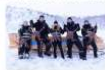
สนุกกับกิจกรรมจับปูยักษ์

00.00 น. ออกเดินทางสู่ เมืองคีร์กเคนส โดยสายการบิน...เที่ยวบินที่... 00.00 น. เดินทางถึงสนามบินเมืองคีร์กเคนส