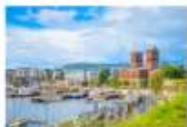
เมืองออสโล

06.10 น. เดินทางถึงนครอิสตันบูล ประเทศตุรกี (แวะเปลี่ยนเครื่อง) 09.00 น. ออกเดินทางสู่กรุงออสโล ประเทศนอร์เวย์ เที่ยวบินที่ TK 1751 11.00 น. เดินทางถึงสนามบินสนามบินเมืองออสโล