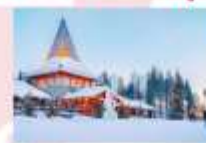
หมู่บ้านซานต้าครอส

15.25 น. ออกเดินทางสู่อิสตันบูล ประเทศตุรกี เที่ยวบินที่ TK 1750 21.10 น. เดินทางถึงสนามบินอิสตันบูล (แวะเปลี่ยนเครื่อง)