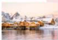
หมู่บ้าน Sakrisoy