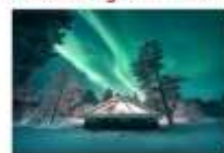
Glass Igloo Hotel

** พักที่ NORTHERN LIGHTS VILLAGE OR SIMILAR **