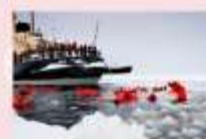
ล่องเรือตัดน้ำแข็ง Ice Breaker