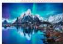
หมู่เกาะโลโฟเทน

00.00 น. ออกเดินทางสู่ เมืองเลกเนส โดยสายการบิน Scandinavian Airlines เที่ยวบินที่ SK 4106 แวะเปลี่ยนเครื่องที่เมือง Bodo เป็นสายการบิน Wide roe WF 810 00.00 น. เดินทางถึงสนามบินเมืองเลกเนส