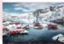
หมู่บ้าน Nusfjord

** พักที่ ELIASSEN RORBUER OR SIMILAR **