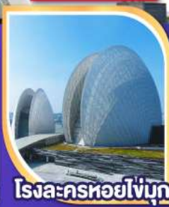
โรงละครหอยโขงบุก