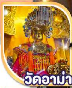
วัดอาน่า