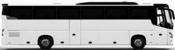
ตัวอย่างรถทัวร์ 1 คัน

ค่าที่พักตามที่ระบุในรายการหรือเทียบเท่าระดับเดียวกัน (พิกห้องละ 2 ท่าน) หากประเภทห้องที่ท่านริเวสมาเป็นเช่นจาก เช่น ริเวสห้องพักเป็น TWIN BED หรือ DOUBLE BED ทางบริษัทขอสงวนสิทธิ์ในการปรับประเภทห้องพัก เป็นตามที่โรงแรมมีอยู่ โดยไม่ต้องแจ้งให้ทราบล่วงหน้า