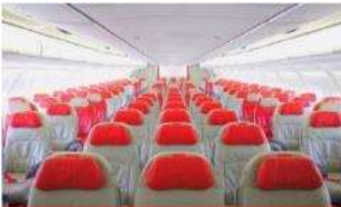
เครื่องบินลำใหญ่ 377 ที่นั่ง