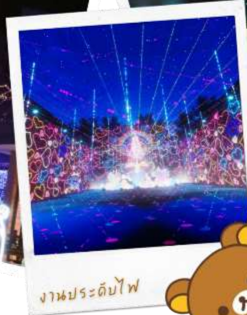
งานประดับไฟ