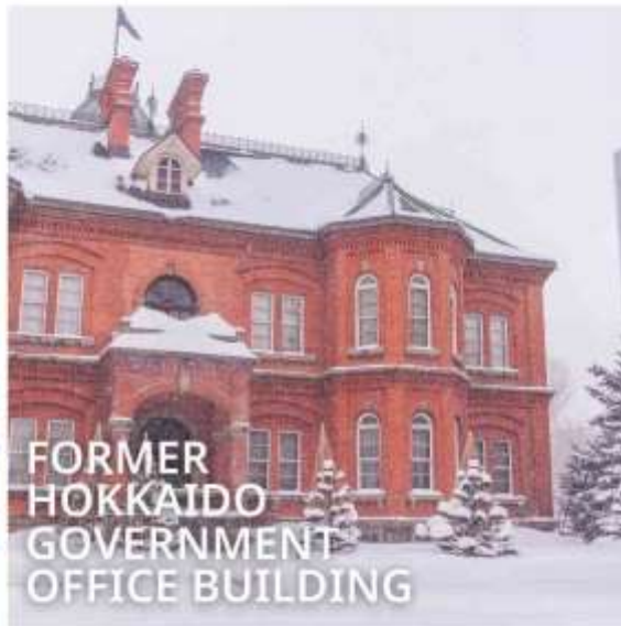
FORMER HOKKAIDO GOVERNMENT OFFICE BUILDING