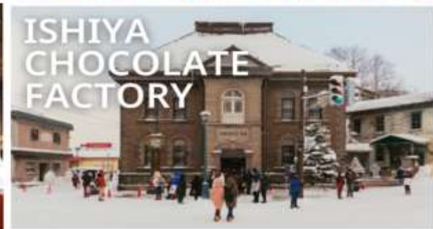
ISHIYA CHOCOLATE FACTORY