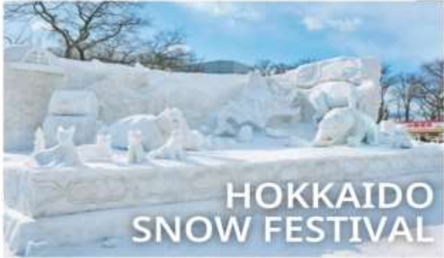
HOKKAIDO SNOW FESTIVAL