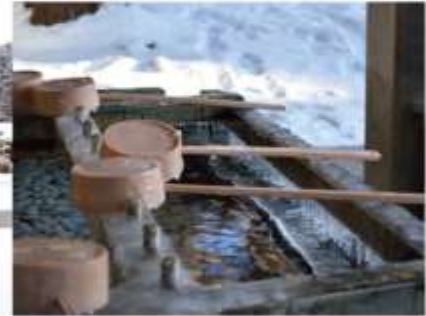
ศาลเจ้าฮอกไกโด

เป็นศาลเจ้าของศาสนาพุทธนิกายชินโตประจำเกาะฮอกไกโด สร้างขึ้นในปี 1871 ยุคเริ่มพัฒนาเกาะ ใต้สัญลักษณ์เทพมาประทับทั้งหมด 4 องค์ จากศาลเจ้ามีพื้นที่เชื่อมต่อกับสวนมารุยามะ ในฤดูใบไม้ผลิเหมาะแก่การชมดอกซากุระบาน ในฤดูร้อน วันที่ 14-16 มิถุนายนของทุกปี จะจัดเทศกาล Sapporo Festival หรือ Sapporo Matsuri ซึ่งจะแห่ขบวนไปตามถนน