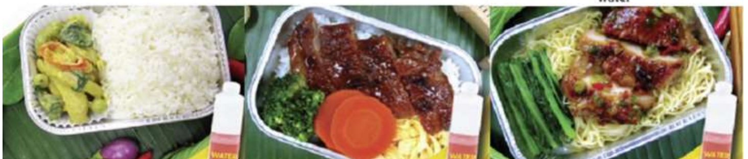
Chicken roasted with herb and noodle and water