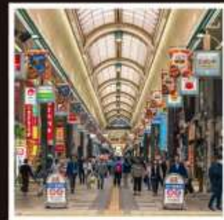
ถนนช้อปปิ้งทานุกิโคจิ

กระเช้าภูเขาฮาโกดาเตะ ชมวิวที่สวยงามที่สุด 1 ใน 3 ของญี่ปุ่น ระดับมิชลิน 3 ดาว Unseen Hokkaido ผลงานสถาปัตยกรรมชิ้นเอก ผสานธรรมชาติอย่างลงตัว “Hill of Buddha” หุบเขานรก จิโกะคุดามิ สัมผัสบรรยากาศของแหล่งกำเนิดออนเซ็นชื่อดังที่สุดแห่งฮอกไกโด ขึ้นตากับภูเขาไฟอูสุ วิวทิวทัศน์อันงดงามและธรรมชาติสุดยิ่งใหญ่ ที่พลาดไม่ได้ ชมฟาร์มโคนมชื่อดัง มิเซโกะ ทาคาฮาชิ กับวิวโยเทสแนพิเศษ ช้อปปิ้งอย่างเต็มอิ่มจุกใจบนถนนทานุกิโคจิและมิตซึยะ เอาก้เล็ก พักออนเซ็น 2 คับ!!! ริมทะเล 1 คับ ริมทะเลสาบ 1 คับ อาหารพิเศษ...บุฟเฟ่ต์ซาบู, บุฟเฟ่ต์ซาบู กรุ๊ปสบายๆ เพียง 20 และ 30 ท่านเท่านั้น!!!