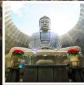
เนินพระพุทธรเจ้า