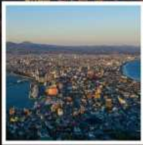
กระเช้าภูเขาฮาโกดาเตะ