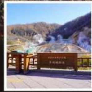
หุบเขานรกจิโกะคุดามิ