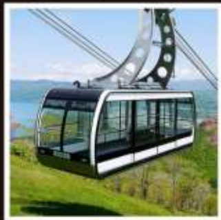
ภูเขาไฟอูสุ