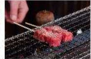
รูปประทานอาหารกลางวัน ณ ภัตตาคาร