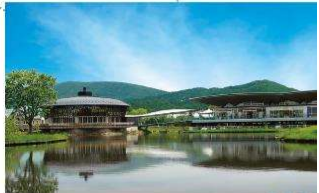
อีโอสระอาหารกลางวันตามฮิโรซากิ (ไม่รวมในรายการ)