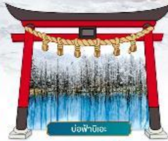
บ่อฟ้านิเอะ

✓ ชมความสวยงามท่ามกลางหิมะ ณ หมู่บ้านเทพนิยาย นิงเกิลเกอเรซ