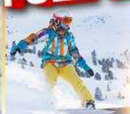
ลานสกีซิกิไซ