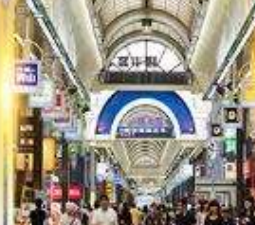
ย่านซุซุกิโนะ