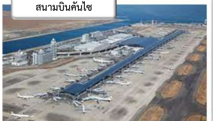
สนามบินคันไซ