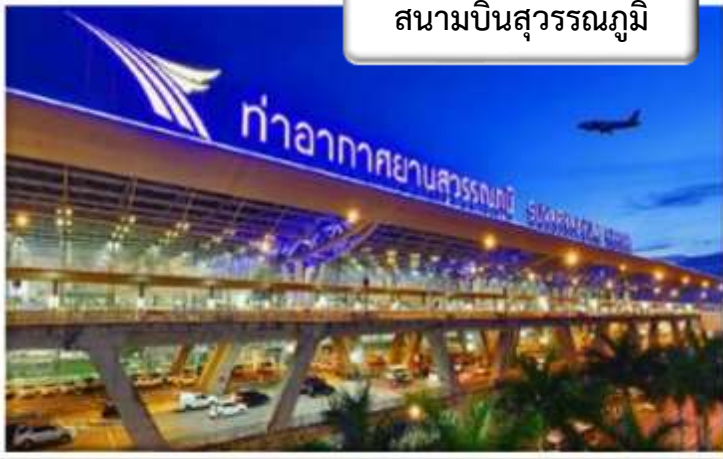
สนามบินสุวรรณภูมิ

เวลา 05.00 น.พร้อมกันที่ สนามบินสุวรรณภูมิ อาคารผู้โดยสารขาออกระหว่างประเทศ เคาน์เตอร์ C สายการบิน ไทยแอร์เวย์ เจ้าหน้าที่คอยให้การต้อนรับดูแลด้านเอกสาร เช็คอิน และสัมภาระในการเดินทาง