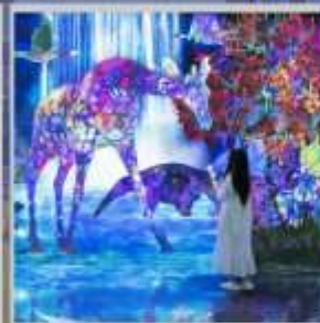
"TEAM LAB FOREST"