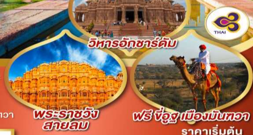
วิหารอักชาร์ดัม