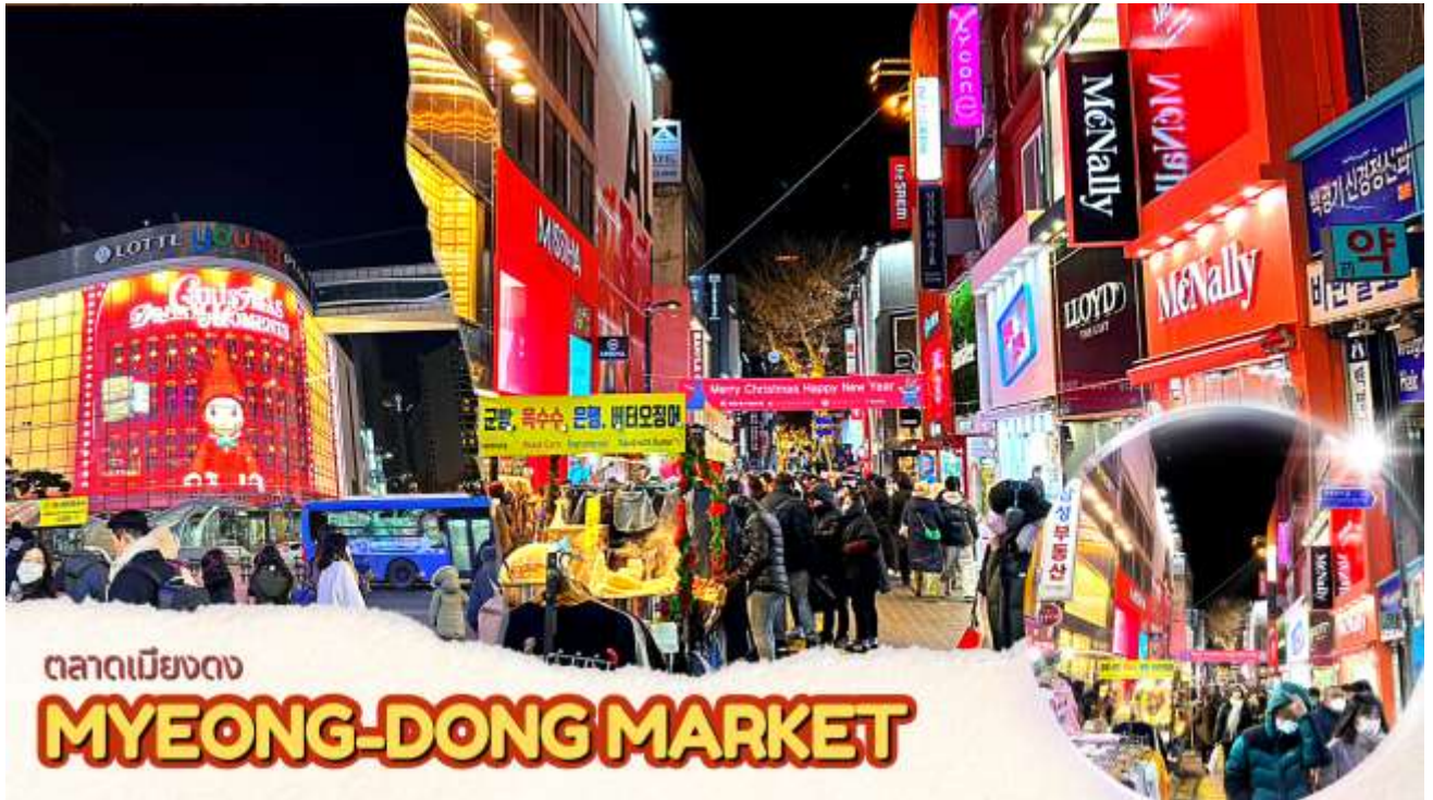
ตลาดเมียงดง MYEONG-DONG MARKET

จากนั้นนำท่านช้อปปิ้งย่าน เมียงดง หรือสยามสแควร์เกาหลี หากท่านต้องการทราบว่าแพชั่นของเกาหลีเป็นอย่างไร ก้าวล้ำทันสมัยเพียงใดท่านจะต้องมาที่เมียงดงแห่งนี้ พบกับสินค้าวัยรุ่น อาทิ เสื้อผ้าแฟชั่นแบบอินเทรนด์ เครื่องสำอางต่าง ๆ ของเกาหลี พบกับความแปลกใหม่ในการช้อปปิ้งอีกรูปแบบหนึ่ง ซึ่งเมียงดงแห่งนี้จะมีวัยรุ่นหนุ่มสาวชาวโซมไปรวมตัวกันที่นี้กว่าล้านคนในแต่ละวัน