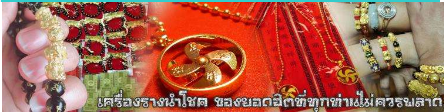
เครื่องรางนำโชค ของยอดฮิตที่ทุกท่านไม่ควรพลาด

จากนั้นนำท่านสู่ ร้านหยก ชมความงามปีเซียะ ที่เชื่อกันว่าเป็นวัตถุมงคลยอดนิยม ที่มีการนำมาบูชา เพื่อให้ช่วยป้องกันสิ่งชั่วร้าย เรียกทรัพย์สินเงินทองให้ไหลมาเทมา และกักเก็บทรัพย์นั้นไม่ให้รั่วไหลออกไปไหนได้ ชาวจีนโบราณเชื่อกันว่า ปีเซียะเป็นสัตว์ประหลาดที่รวมลักษณะของสัตว์มงคลทั้ง 5 ชนิดไว้ด้วยกัน ได้แก่ มังกร พญาราชสีห์หรือสิงโต, อินทรี, กวาง, และแมว โดยตามตำนานเล่าว่า ปีเซียะเป็นลูกมังกรตัวที่ 9 (เทพแห่งโชคลาภ) ของพญามังกรสวรรค์ มีชื่อเรียกด้วยกันหลายชื่อไม่ว่าจะเป็น “เทียนลก (กวางสวรรค์)” เป็นชื่อเดิม ส่วนจีนกลางตุ้งจะเรียกว่า “เผ่ย่า” และคนจีนแต้จิ๋วจะเรียกว่า “ผีซิว” และ ยังมีจำหน่ายยาสมุนไพรบำรุงเพิ่มความแข็งแรงตามความเชื่อของคนฮ่องกง