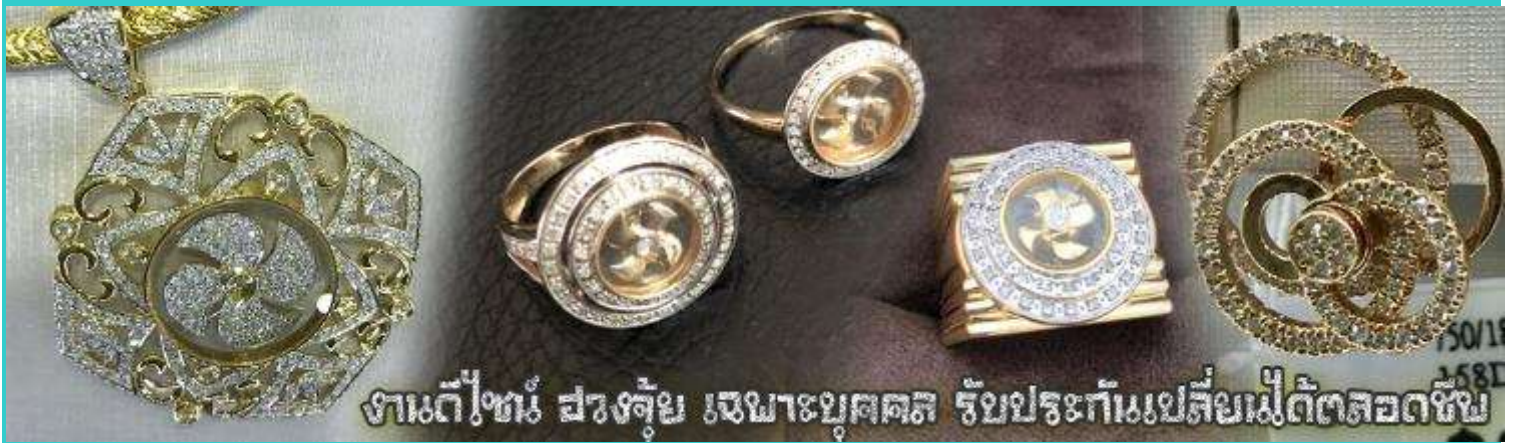
งานตีไข่มุข สวยล้ำเลิศ เหมาะยุคคน รวยประทีปแปดสีไม่ตัดตลอดชีพ

จากนั้นนำท่านสู่ ร้านหยก ชมความงามปีเซียะ ที่เชื่อกันว่าเป็นวัตถุมงคลยอดนิยม ที่มีการนำมาบูชา เพื่อให้ช่วยป้องกันสิ่งชั่วร้าย เรียกทรัพย์สินเงินทองให้ไหลมาเทมา และกักเก็บทรัพย์นั้นไม่ให้รั่วไหลออกไปไหนได้ ชาวจีนโบราณเชื่อกันว่า ปีเซียะเป็นสัตว์ประหลาดที่รวมลักษณะของสัตว์มงคลทั้ง 5 ชนิดไว้ด้วยกัน ได้แก่ มังกร พญาราชสีห์หรือสิงโต, อินทรี, กวาง, และแมว โดยตามตำนานเล่าว่า ปีเซียะเป็นลูกมังกรตัวที่ 9 (เทพแห่งโชคลาภ) ของพญามังกรสวรรค์ มีชื่อเรียกด้วยกันหลายชื่อไม่ว่าจะเป็น “เทียนลก (กวางสวรรค์)” เป็นชื่อเดิม ส่วนจีนกลางตุ้งจะเรียกว่า “เผ่ย่า” และคนจีนแต้จิ๋วจะเรียกว่า “ผีซิว” และ ยังมีจำหน่ายยาสมุนไพรบำรุงเพิ่มความแข็งแรงตามความเชื่อของคนฮ่องกง