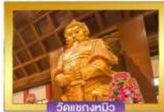
วัดเข่งกวมิว