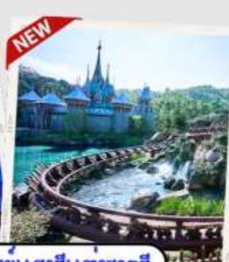
“MOMENTOUS” ทรัพย์สินรบบแสงสีแพงราตรี