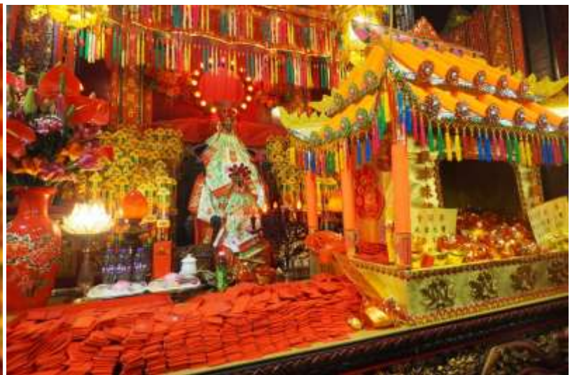
แถมฟรี แผ่นทองเจ้าแม่กวนอิม ประธานพรโชคลาภ เงินทอง