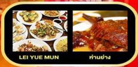
LEI YUE MUN