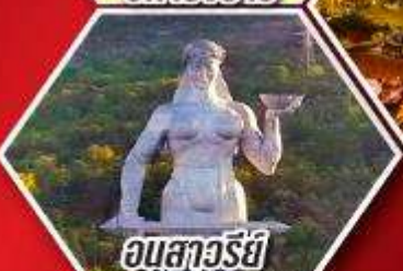
อนสาวรีย์