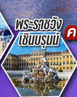
พระราชวัง เซินบรุนน์