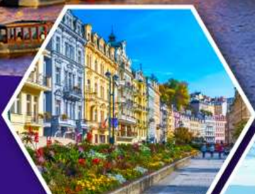
คาร์โลวารี