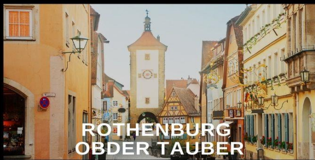
ROTHENBURG OBDER TAUBER