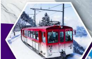
นั่งรถไฟไต่เขาริก