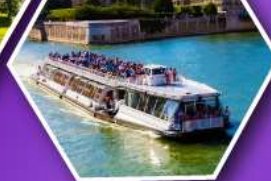
ล่องเรือบาโตมุซ ชมกรุงปารีส

เที่ยวเมืองวาอูซ เมืองหลวงของสาธารณรัฐ ลิกเทินสไตน์