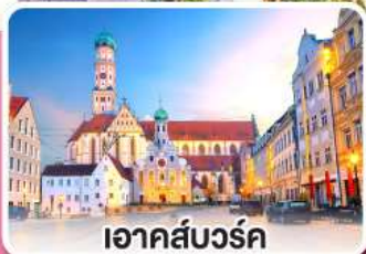
เอาคส์บวร์ค