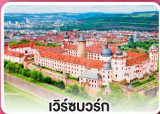
เวิร์ชบวร์ค