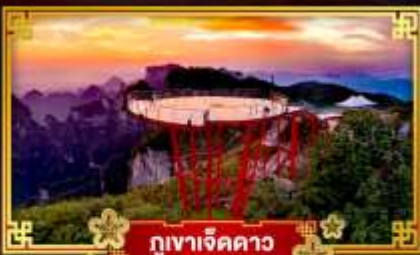
กุเขาเจ็ดดาว