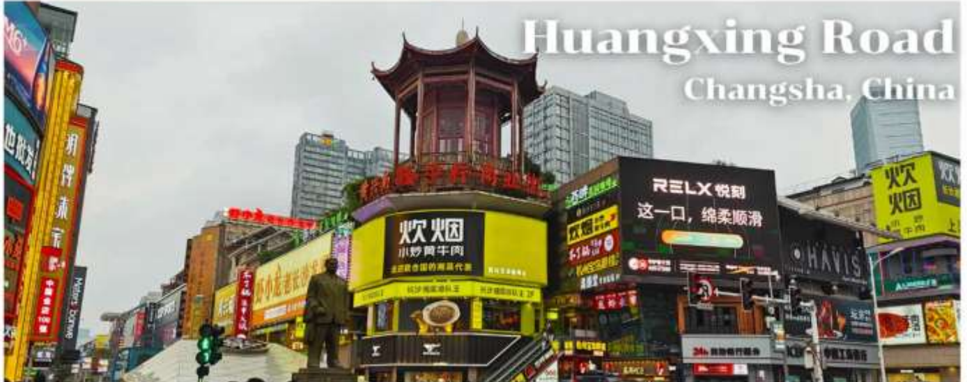
Huangxing Road Changsha, China