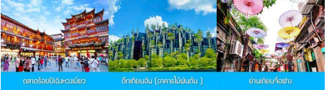
ตลาดร้อยปีฉางเหมียว

พักที่ โรงแรม Heyi Hotel or Holiday Inn Express Hotel 4* หรือเทียบเท่าในเมืองเชียงใหม่