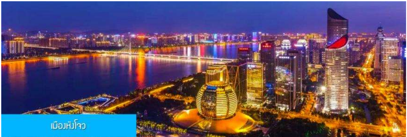
เมืองหังโจว