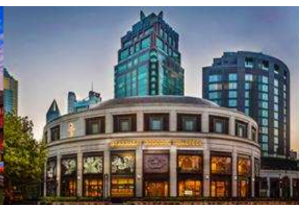
สตาร์บัคใหญ่ที่สุดในโลก