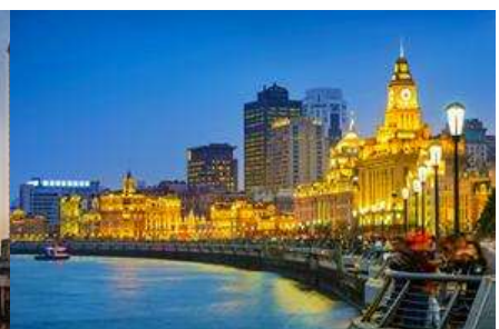
หาดไว่กาน