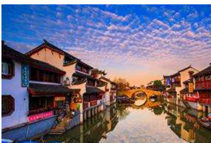
เมืองโบราณ ซิเป่า

พักที่ โรงแรม Liangan Hotel or Holiday Inn Express Hotel 4* หรือเทียบเท่าในเมืองหังโจว