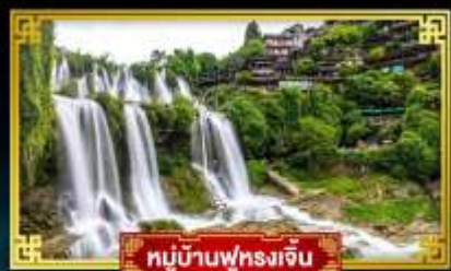
หมู่บ้านฟุทงเจี้ยน