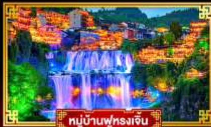
หมู่บ้านฟูรงเจิ้น