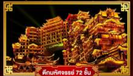
ตึกมหิศจรรย 72 ชั้น