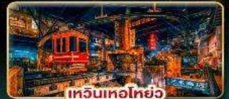
เทวินเทอไฮเวย์