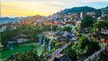
เมืองโบราณฟูหรงเจิน