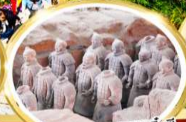
กองทัพทหารดินเผาจีนซี