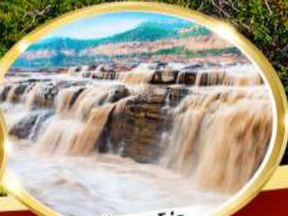
น้ำตกหูโข่ว