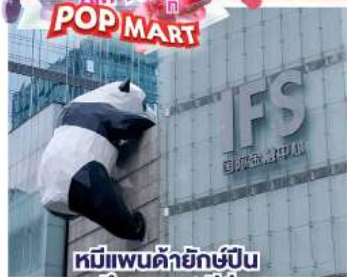
หมีแพนด้ายักษ์เป็น ตักถนนซุนซีลู่

01-06, 02-07, 04-09, 05-10, 07-12 เม.ย.68 08-13, 09-14 เม.ย.68 เทศกาลสงกรานต์ 10-15, 12-17, 13-18, 14-29, 15-20 เม.ย.68 17-22, 18-23, 19-24, 21-26, 22-27, 24-29 เม.ย.68 27 เม.ย. - 02 พ.ค.68 / 29 เม.ย. - 04 พ.ค.68 02-07, 09-14, 11-16, 16-21, 18-23, 23-28 พ.ค.68 30 พ.ค. - 04 มี.ย.68