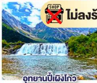
อุทยานπίเฝงโกว