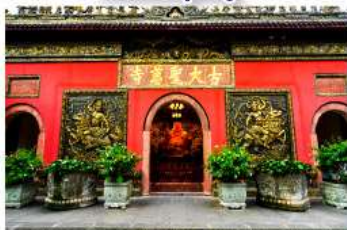
วัดต้าฉีอู๋