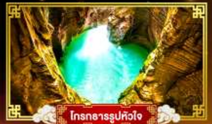
โตรถการรูปหัวใจ