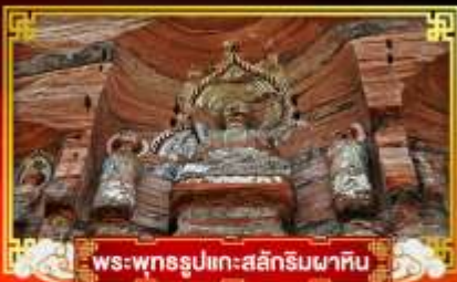
พระพุทธรูปแกะสลักหินผาศิน