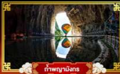
ถ้ำพญามังกร