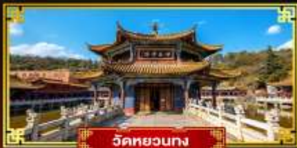
วัดหยวงทง

มหัศจรรย์ "แผ่นดินสีแดงดวงชวน" นั่งกระเช้าขึ้นสู่อยอดภูเขาหิมะเจี๋ยจื่อ