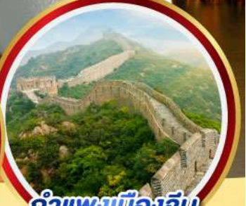
กำแพงเมืองจีน ด่านจวิ๊ยกทวน