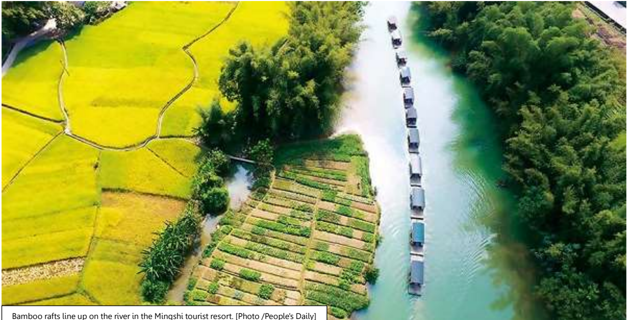
Bamboo rafts line up on the river in the Mingshi tourist resort.

แม่น้ำหมิงซือ Mingshi มีต้นกำเนิดในเวียดนาม และไหลจาก Niandoutun เข้าสู่ประเทศจีน ซึ่งไหลไปทางตะวันออกเฉียงใต้ Jingtang, Mingshi, Kanwei, Lushan, Houyi ฯลฯ ในที่สุดแม่น้ำหมิงซือก็ไหลมาบรรจบกับแม่น้ำเฮยสุ่ย มีความยาวทั้งสิ้น 44.13 กิโลเมตร