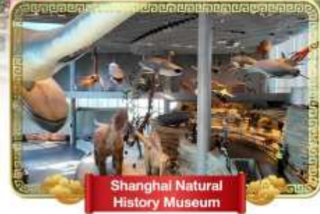
Shanghai Natural History Museum