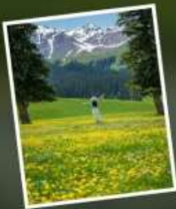
ทุ่งหญ้านาราตี

รับฟรี!! AIG ประกันสุขภาพ และ อุบัติเหตุ 2 ล้านบาท