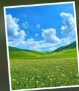
ทุ่งหญ้าแห่งท้องฟ้า