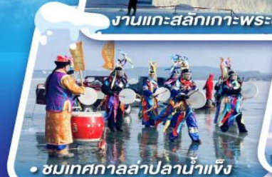
ชมเทศกาลสาปน้ำแข็ง