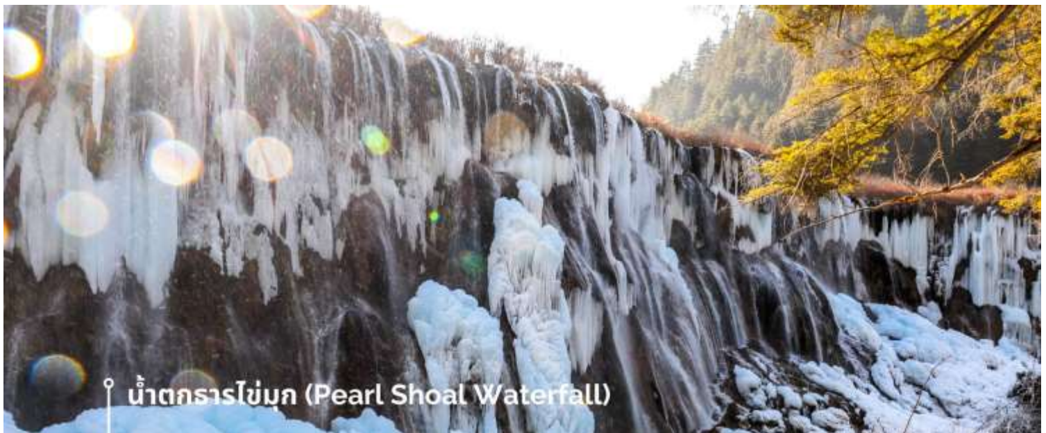
น้ำตกธารไข่มุก (Pearl Shoal Waterfall)

หรือ น้ำตกบูริออลาง (Nuo Ri Lang Waterfall) ถือเป็นน้ำตกที่ใหญ่ที่สุดในจิวจ้ายโกว มีความสูง 40 เมตร กว้าง 310