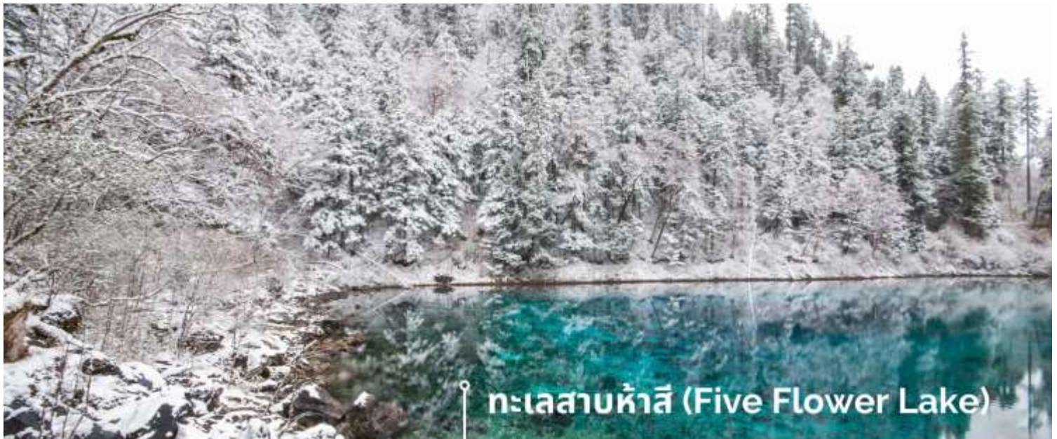
ทะเลสาบห้าสี (Five Flower Lake)

หนึ่งในจุดที่สวยงามและนักท่องเที่ยวแห่มาเยี่ยมชมเยอะที่สุด ตั้งอยู่ที่ความสูงเหนือระดับน้ำทะเลประมาณ 2,472 เมตร น้ำลึกประมาณ 5 เมตร น้ำใสจนเห็นพื้นด้านล่างของทะเลสาบ สีของผิวน้ำสวยงามแปลกตา โดยเฉพาะเมื่อยามแสงอาทิตย์สาดส่องกระทบผิวน้ำ สีของน้ำในทะเลสาบจะสะท้อนเป็นสีส้มถึง 5 เฉดสี สวยงามสะกดตา ซึ่งสาเหตุที่ทำให้เกิดสีสันต่างๆ นี้มาจากการสะสมของแร่ธาตุ และพืชน้ำชนิดต่างๆ โดยจะมีสีสันแตกต่างกันไปตามฤดูกาลและ