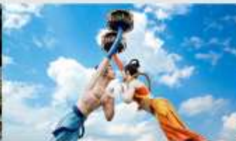
Wulong Flying Kiss