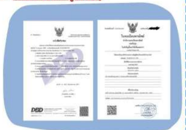
ตัวอย่างหนังสือจดทะเบียนบริษัท และ ใบทะเบียนพาณิชย์