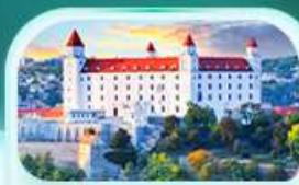
ปราสาทบราติสลาว่า

เที่ยวชมเมืองอัลสส์ดัทท์ หมู่บ้านริบะทะเลสาบสวยที่สุดในโลก พระราชวังเชินบรุนน์ เมืองลินซ์ จิตรกรรมฝาผนังยักษ์ สัมผัสเมืองมรดกโลก เซสท์ ครุมลอฟ เยี่ยมชมปราสาทปราก ถนนทองคำ เช็กอินสถานที่ชื่อดัง! ปราสาทบราติสลาว่า ล่องเรือชมความงามแม่น้ำดานูบ แม่น้ำที่ยาวที่สุดในยุโรป ชมความน่าหลงใหลของ ปราสาทบูคาเปสต์ สะพานชาร์ลส์